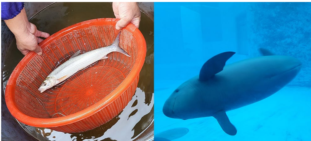
^ A gauche : le poisson tube, en danger critique d'extinction – le dernier stade avant l'extinction à l'état sauvage d'après l'Union internationale pour la conservation de la nature – a refait son apparition sur une dizaine des 57 sites étudiés. A droite : marsouin aptère à l'Institut hydrobiologique de Wuhan.